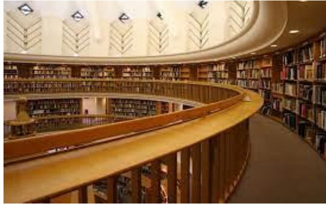
国際日本文化研究センター図書室（京都）