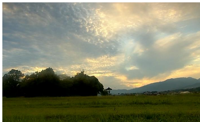
藤原京跡 (奈良県橿原市、明日香村)