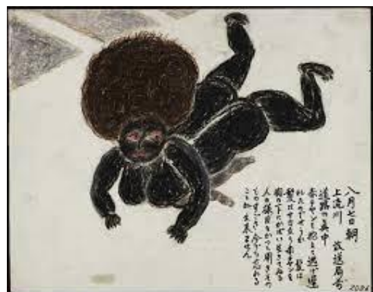
田口光子作（広島平和記念資料館所蔵）

その後、その母子の姿を目撃した被爆者 10 人が、その姿を、数 10 年も後に絵に残したのである。