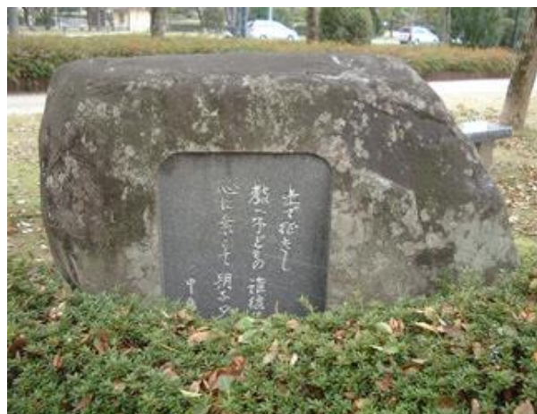
広島中央公園 「広高の森」に建つ中島光風歌碑