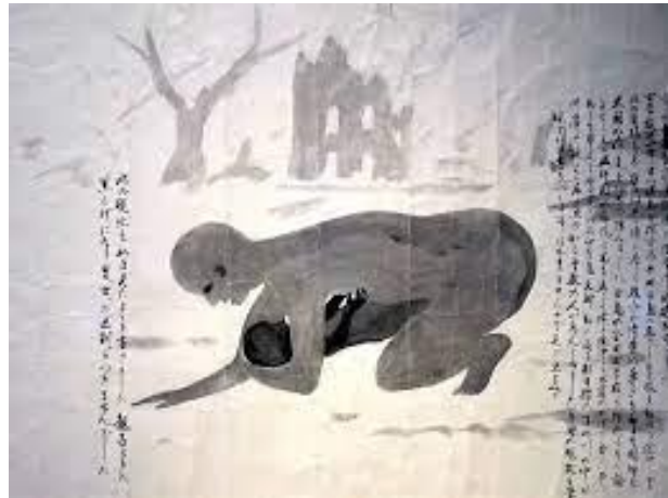
谷本初登作（広島平和記念資料館所蔵）